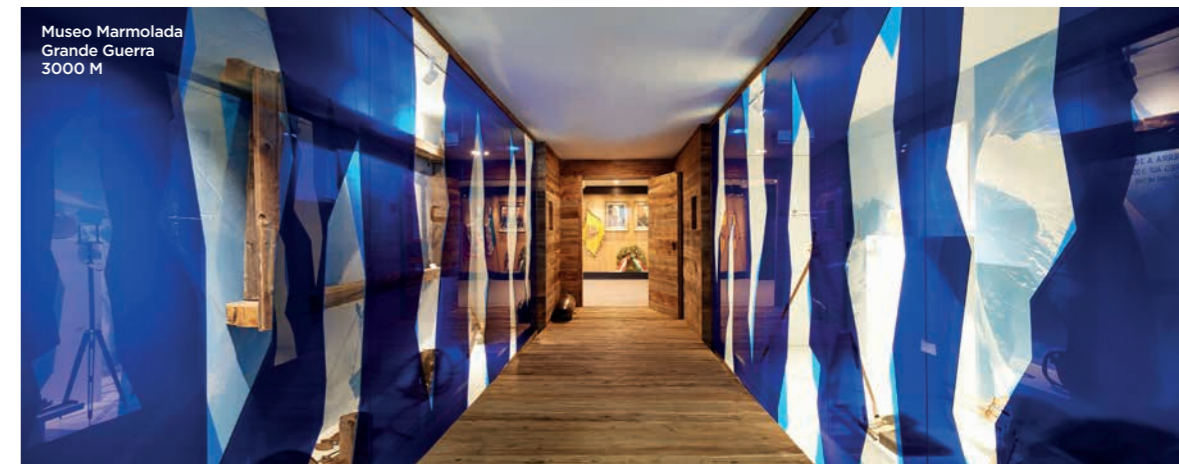
Museo Marmolada Grande Guerra 3000 M

In this area rich in natural raw materials was born a tradition that is still handed down: the handwork of iron and wood. From the craftsmen's talent were created at first agricultural tools, that nowadays became decorative objects. In Sottoguda you can visit the shops where the hand-painted ironwork butterflies or the jewels in beech wood and Swarovsky® crystals are made.