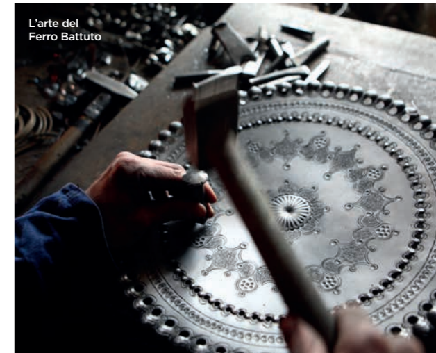
L'arte del Ferro Battuto

In un territorio ricco di materie prime è nata una tradizione manuale che si tramanda ancora oggi: la lavorazione del ferro e del legno. Dall'abilità degli artigiani sono nati dapprima attrezzi agricoli, poi oggetti di decoro. A Sottoguda è possibile visitare le botteghe dove vengono realizzati le famose farfalle in ferro battuto dipinte a mano e i gioielli in legno di faggio e cristalli Swarovsky®.