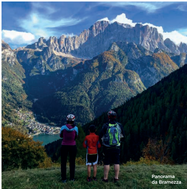
Panorama da Bramezza

In Rocca Pietore there are lots of opportunities: visit ancient hamlets, discover the architecture of the local haylofts, the old houses and lots of amazing views. Don't miss the chance to explore Sottoguda, one of the most beautiful little villages in Italy, Laste or Bramezza.