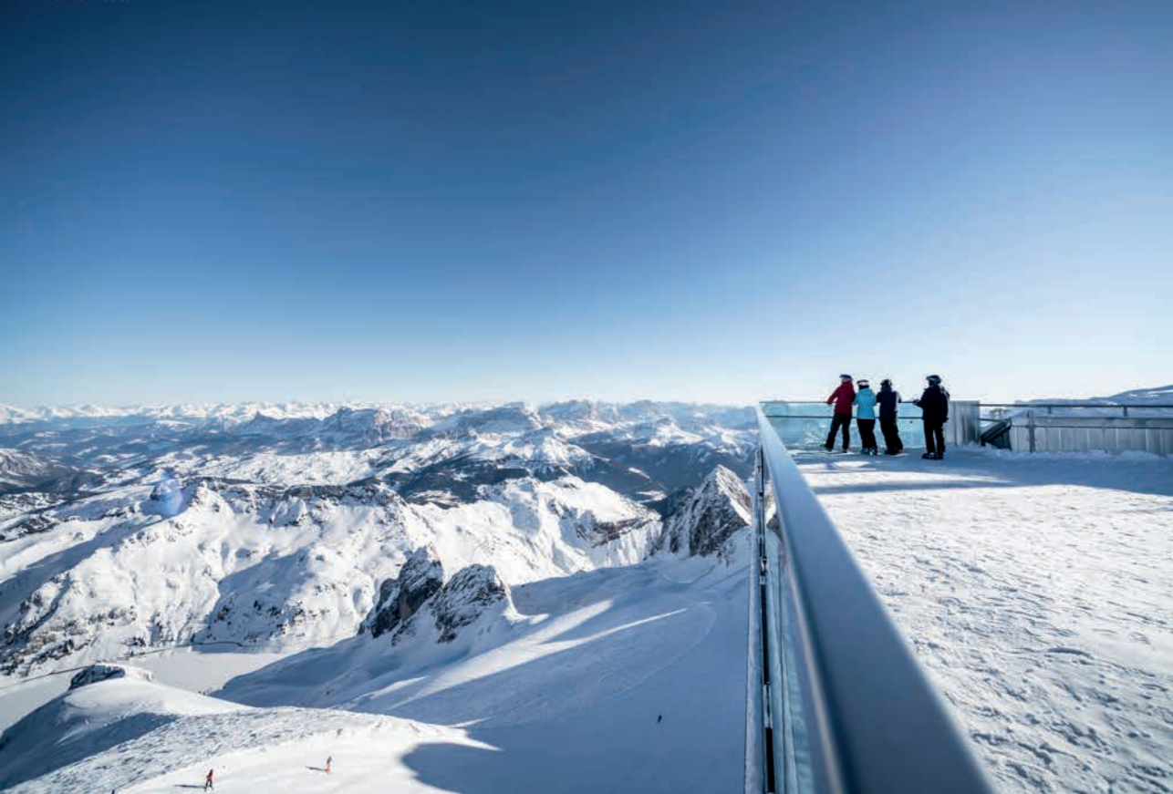
Terrazza panoramica di Punta Rocca